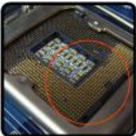
ซ็อกเก็ตใส่ซีพียูหัก