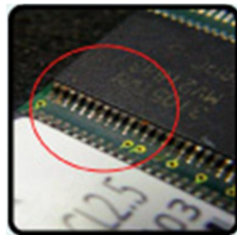
คราบสนิม