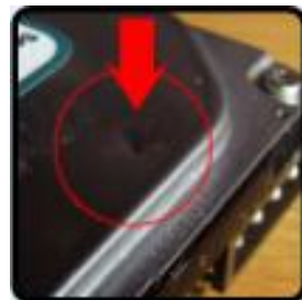
บุบ หรือ ยุบ