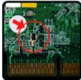
คราบออกซายด์