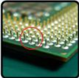
ขาจอ หรือหัก