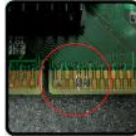
ชิ้นส่วนหลุดลอก