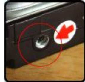
สกรูมีร่องรอยเสียหาย