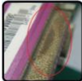
รอยคราบสนิม